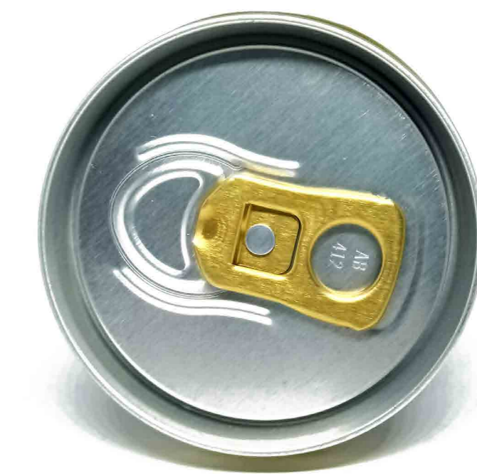
BOUNDARY COLLECTION PIECES - HATÁRVONAL KOLLEKCIÓ RÉSZLETEI, 2017-2020